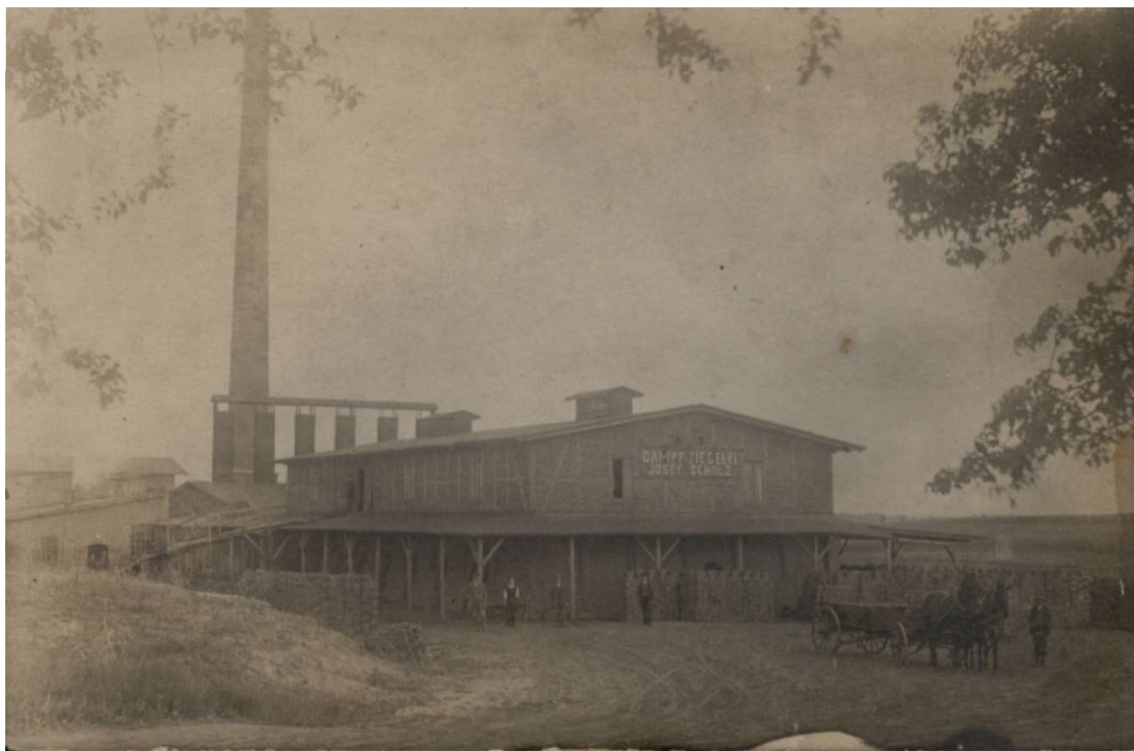
Na ścianie frontowej widnieje napis po niemiecku DAMPF - ZIEGELEI JOZEF SCHOLZ